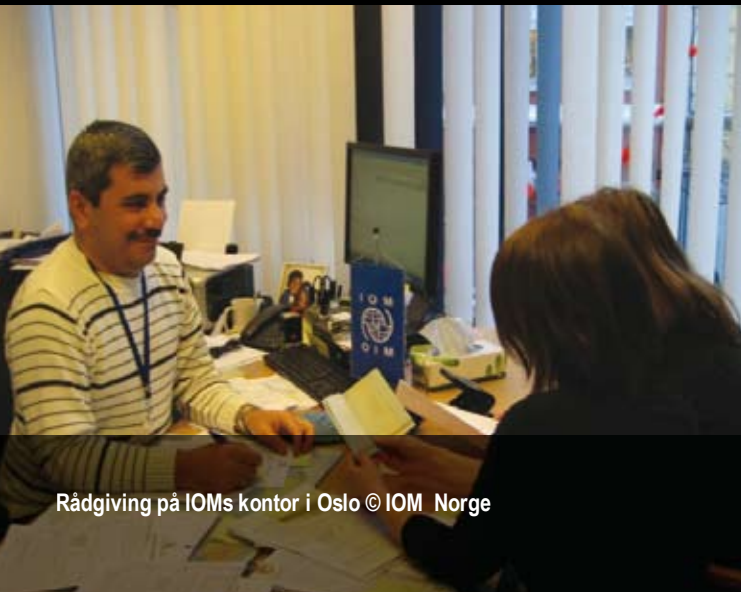
Rådgiving på IOMs kontor i Oslo

IOM Afghanistan har tett samarbeid med den afghanske regjeringen (Flyktning- og repatrieringsdepartementet), UNHCR, Flyktninghjelpens kontor i Kabul og andre frivillige organisasjoner som vil assistere deg med reintegreringen i hjemlandet ditt.