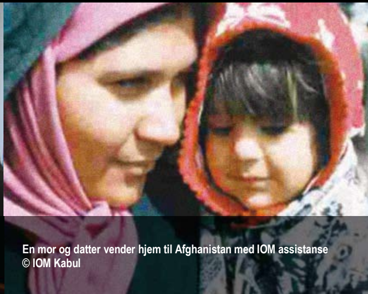
En mor og datter vender hjem til Afghanistan med IOM assistanse